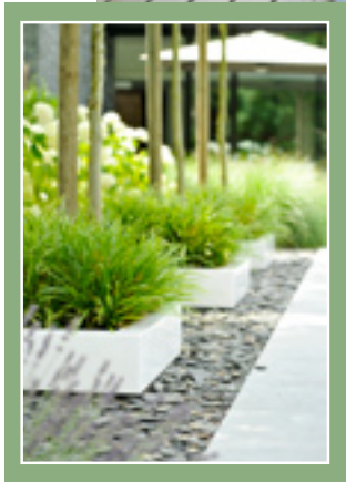
Relaxen komt in deze tuin duidelijk op de eerste plaats. Zo is er onder meer plaats voor een panoramische sauna, een zwembad, een jacuzzi en een buitendouche.